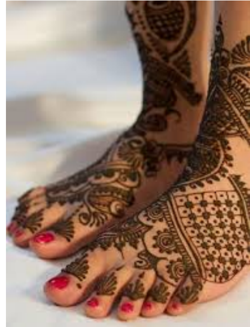
Traditionelles Hennamuster auf Füßen