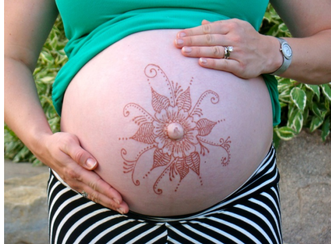
Verzierung in Hennatechnik