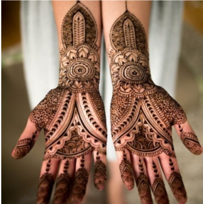
Traditionelles Hennamuster auf Händen

Auch im westlichen Kulturkreis findet die Bemalung mit Henna mittlerweile viele AnhängerInnen. Meist von rituellen oder kulturellen Kontexten losgelöst, wird es als temporäres Henna-Tattoo zur Verzierung genutzt.